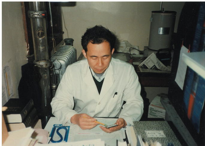
1986 年在实验室计算用化学反应法制备载体催化剂的聚合动力学实验结果

\text{MgCl}_2 在形成可溶性复合物时,另外加入 Lewis 碱是十分重要的。在没有外加 Lewis 碱的情况下,复合物与 \text{TiCl}_4 反应析出的晶体 [\text{MgCl}_2(\text{s})] 的结构为规整的立方密堆积(ccp)和六方密堆积(hcp)(见反应式 5 和 6);外加 Lewis 碱后,就得到 \text{MgCl}_2 \cdot \text{LB} (见反应式 4),析出的晶体为带有旋转无序(rd)缺陷形式的 \text{MgCl}_2 \cdot \text{LB}(\text{s}) (见反应式 7),是高效催化剂的最好载体。上述机理既适用于化学结晶法,也适用于球形载体法。