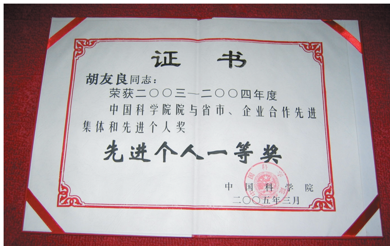
2005年获得先进个人一等奖证书

2000年以来的二十年是我们研究团队既出成果又出人才的二十年,也是我们研究团队的事业逐渐完成代际传承的二十年。在国家和企业数千万元科研经费资助下,我们发表了数百篇的研究论文,申请了数十件的发明专利,也得到了不少的奖励。在这个良好的研究环境熏陶下,我们培养的学生得到了长足的进步。现在,他们中的好多已经成为了研究骨干和学术带头人,以及研究院和大学学院的主管领导。在此,我只简单叙述这二十年里我们共同得到的几个研究成果,学生们会各自详细介绍他们自己的业绩。