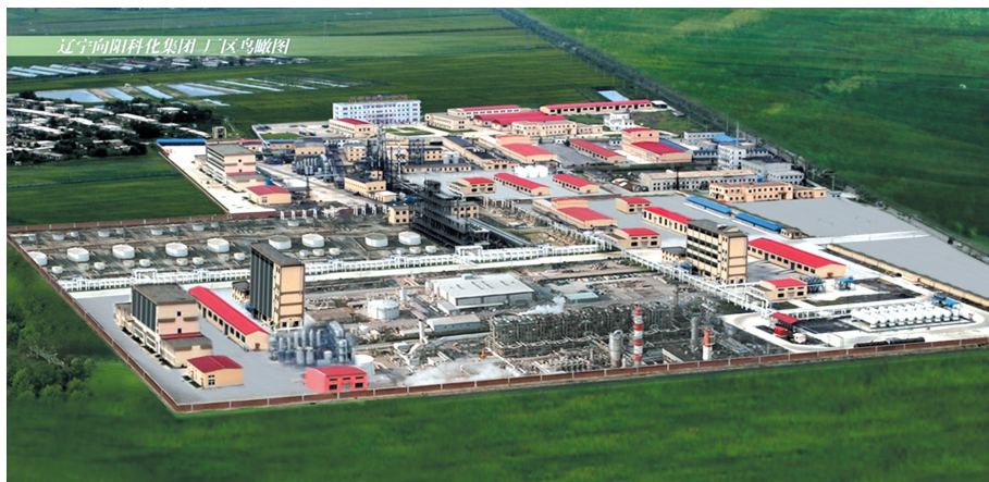
与我们合作研究开发聚烯烃高效催化剂的营口向阳化工厂(现为营口向阳科化集团)

科学在不断发展,聚烯烃催化剂的研究也在不断进步。在齐格勒-纳塔催化剂成功产业化以后,我们没有停止前进的脚步。一方面,协助营口向阳厂的技术和销售员跑遍全国的大小聚烯烃生产厂家推广国产催化剂;另一方面,在不断扩大和改进该厂的催化剂生产装置,尤其是主要原料 \text{TiCl}_4 的蒸馏回收装置的建设和改造,既解决了环境污染问题,又大大降低了催化剂生产成本。此时的国产化催化剂利润丰厚,但价钱还只有进口催化剂的三分之一。因此,国产催化剂很快替代了全国的大小聚烯烃生产企业原使用的进口催化剂,产生了很好的社会效益。我们研究团队也因CS催化剂的成功研发先后获得中科院科技进步一等奖,辽宁省科技进步一等奖,国家科技进步三等奖等奖励。靠着我们双方的共同努力,一项技术,一个产品,壮大了原来只有十几个员工和百万资产的乡村企业,几年内,年销售额就达到数亿元。