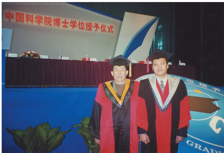
2000年作为博士生导师代表参加中科院研究生院博士学位授予仪式

要做好科研工作,人才是关键,事业要一代接一代传承下去,才能发扬光大。我十分重视人才培养,先后培养了三十多位从事聚烯烃研究的博士生和硕士生。现在,他们有的已经成为技术骨干和学术带头人,有的是著名大学的教授,有的是研究院和大学学院的主要领导人。他们在我们研究团队学习和工作期间,我们既是师生,又是朋友,师生教学相长。我认为,基础研究是实现成果转化的根基,没有扎实的基础研究成果,就像大树没有了根,流水没有了源,是没有生命力的。我与学生们一起先后完成了两项有关新一代聚烯烃催化剂研究的国家自然科学基金重点项目,取得了良好的成绩,学生们也因此打下了从事基础研究的深厚功底。我对学生要求很严,但对自己要求更严。我总认为身教重于言教。我不但教学生如何做事、做学问,而且教学生如何做人,做一个堂堂正正的科学工作者。即使他们毕业后从我们研究团队离开了,我也是对他们非常关心,指导他们如何申请项目,如何做好学术骨干和带头人等。我是真正要把学生扶上马再送一程,直到他们跃马扬鞭快速前进才放心。