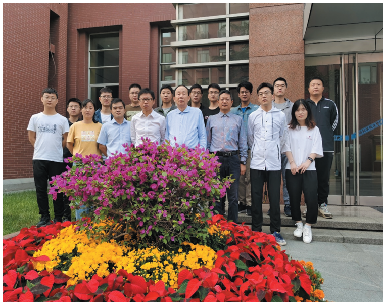
2020 年我们现在的研究团队在化学所礼堂前的合影